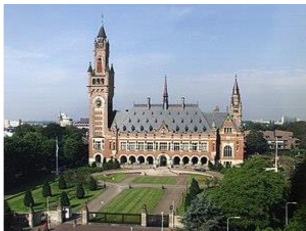
Palata mira u Hagu. 39

Međunarodni sud pravde- Međunarodni sud pravde je pravni organ Ujedinjenih naroda i njegov Staut je sastavni dio Povelje Ujedinjenih nacija/naroda. Svaka država koja postane država članica Ujedinjenih nacija istodobno postaje ugovorna strana Međunarodnog suda. Kao strane u sporu pred sudom mogu se pojaviti samo države i njihovo sudjelovanje u postupku pred sudom je dobrovoljno, ali ako prihvate jurisdikciju 3 suda, tada su obavezne poštovati odluke suda. Sud sudi na temelju međunarodnih ugovora, međunarodnog običajnog prava i opštih pravnih načela. Sud čini 15 sudaca koje bira Generalna skupština i Vijeće sigurnosti na razdoblje od 9 godina sa pravom reizbora. Sjedište suda se nalazi u Hagu. 38