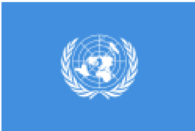
Zastava Ujedinjenih nacija 25