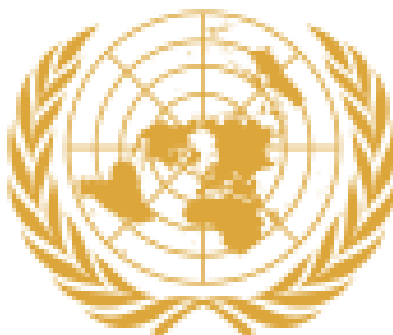
Grb Ujedinjenih nacija 26